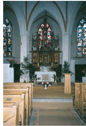
Die Kirche in Mittenwalde